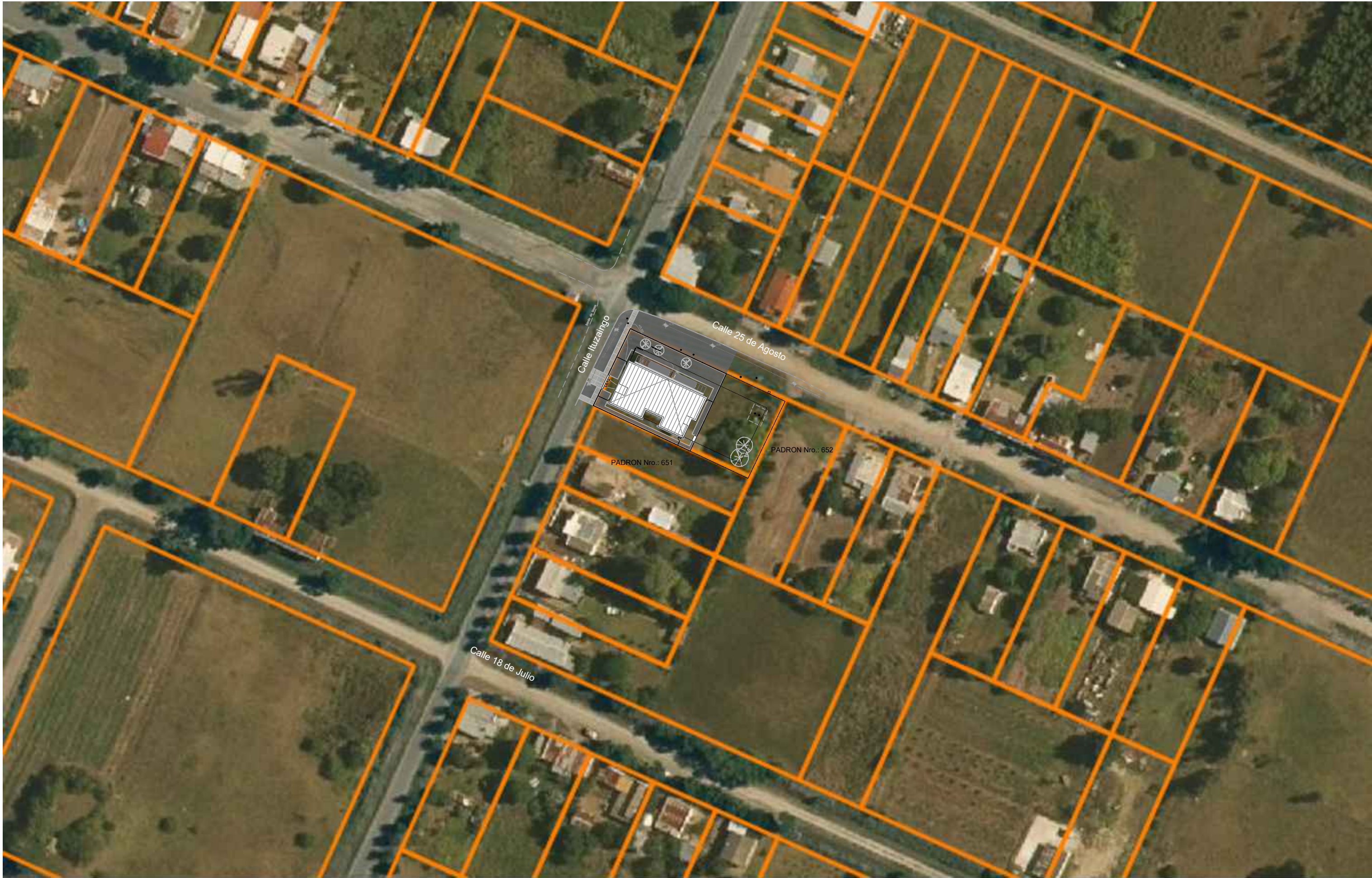
PLANTA DE UBICACIÓN 1:1000